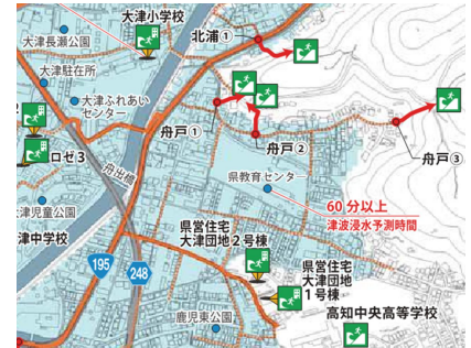
高知市津波避難マップ「大津小学校区」 第2版(令和元12月)より