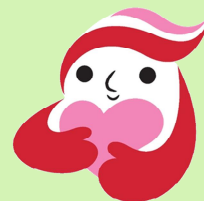
犯罪被害者等支援シンボルマーク 「ギョっとちゃん」