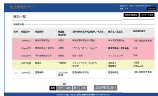
◀ 報告書登録済みの場合