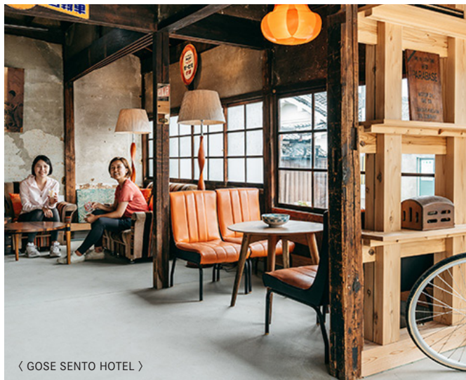
〈 GOSE SENTO HOTEL 〉