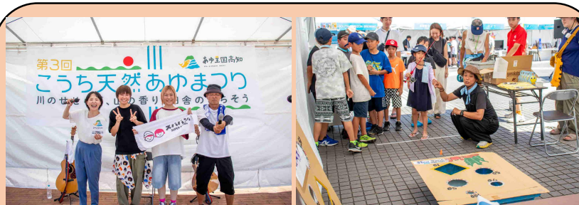
拡 第4回こうち天然あゆまつりの開催