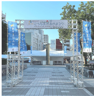
観光客を対象としたPRイベント「こうち天然あゆまつり」の開催

【第 1 回開催】 令和 7 年 11 月 6 日（木） 【開催内容】 実施した情報発信等について議論