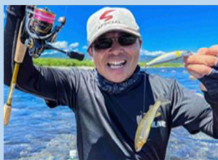
図 アユイングの様子