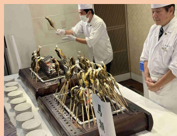
拡 利き鮎会等でのPR