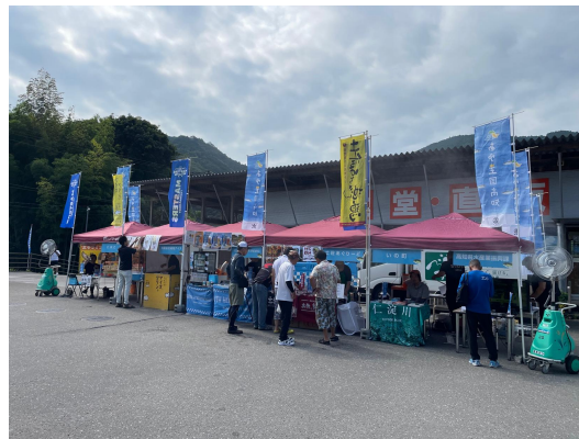
仁淀川でのあゆ釣り全国大会 決勝大会の誘致及び会場でのPR