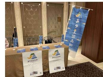
第26回清流めぐり利き鮎会でのPR