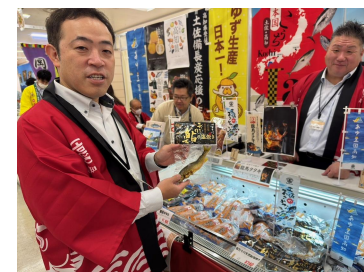
第 64 回農林水産祭 「実りのフェスティバル」でのPR