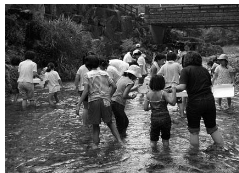
地域の子どもたちによる水生生物調査

また、これらの人材育成は、学校教育だけで成し遂げることはできず、地域住民やNPO、行政機関など多くの主体が連携し相互に取組むことが必要です。