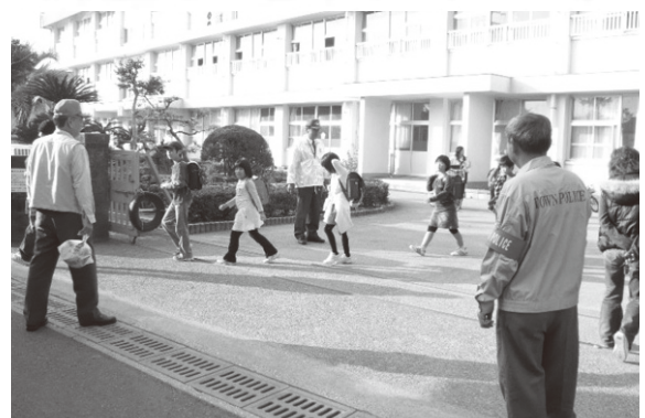
(写真:三里タウンポリス 子ども見守り活動)

平成25年中、県内では、児童への声かけやつきまとい等の不審者情報が226件寄せられており、今後も引き続き、子ども見守り活動が行われる必要があります。