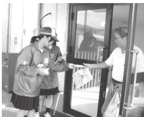
(写真:清水高生徒会盗難被害防止キャンペーン)