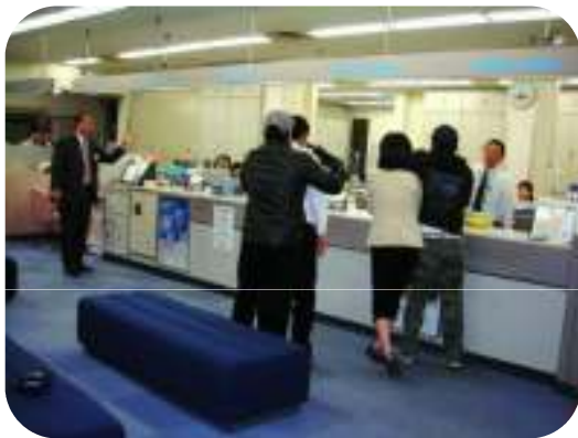
金融機関強盗訓練の様相

コンビニエンスストアなどの深夜小売店舗に対し、夜間複数勤務、通報機器や防犯カメラの設置、カラーボールの配備など防犯体制の整備について啓発を行います。 (生活安全企画課)