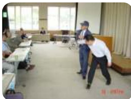
護身術訓練の様 様

※50 高知県DV被害者支援計画・・・「配偶者からの暴力の防止及び被害者の保護に関する法律」第2条の3に規定されている、配偶者からの暴力とその被害者の保護に関する取組を総合的、体系的に実施するための県の計画をいいます。