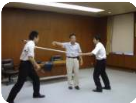
「さすまた」訓練の模様