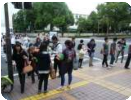
大学生ボランティア「YCPK」による広報啓発活動

また、地域の事業者や学校、団体などの若者や現役世代に対して、防犯活動団体が行う啓発活動等への参加を呼びかけることにより、幅広い世代による防犯活動への参画を促進します。 (県民生活・男女共同参画課、生活安全企画課)