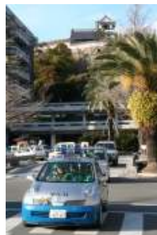
青色回転灯装備車両による防犯活動

※37 安全シェルター活動 …事業者や地域住民が、子どもや女性などの弱者を犯罪や事故から守るため、「こども110番のいえ」、「安全安心推進の店」、「かけこみ110番連絡所」などの名称で、緊急時に民家や事業所を安全シェルターとして提供する活動をいいます。