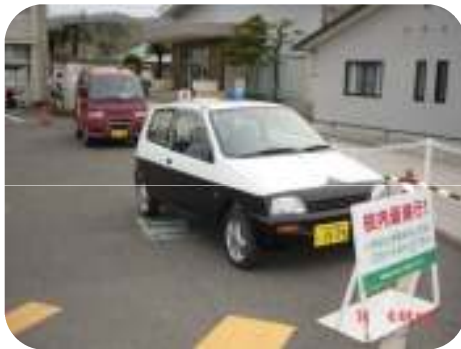
朝倉第二小学校で待機する青色回転灯装備車両