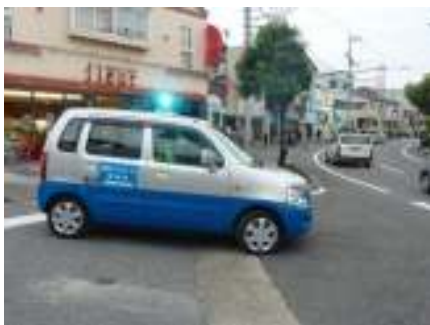
青色回転灯装備車両による防犯活動