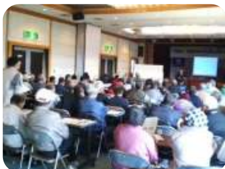
高齢者教室の様 様