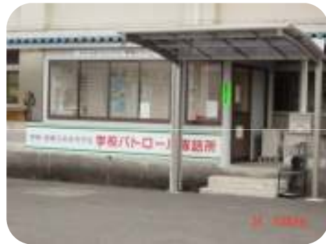
朝倉第二小学校に設置している学校パトロール隊詰所の模様