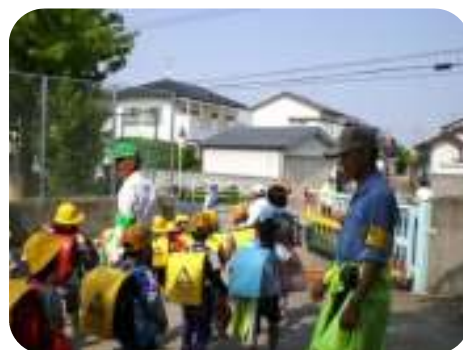
登下校時の見守り活動の様相

※48 高知県学校・警察連絡制度・・・児童生徒の問題行動等に対し、教育委員会・学校、警察が問題の所在を相互に理解して連携を図り、子どもの健全育成に役立てるための制度。