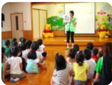
誘拐被害防止教室の様相