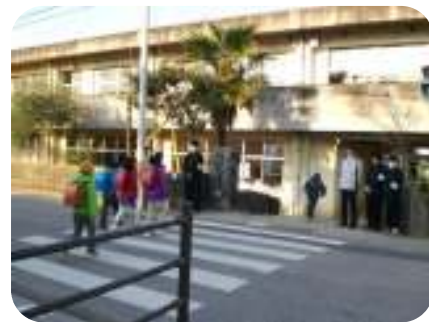
高校生ボランティア「高岡高校サンスマイル」による子どもの見守り活動

※38 友愛訪問活動 ・・・孤立しがちな一人暮らしの高齢者などを、地域のボランティアによる安否確認や話し相手、身の回りの世話などにより暖かく見守り、高齢者が社会とのつながりを保ち、安心して暮らすことのできる地域づくりをめざす活動をいいます。