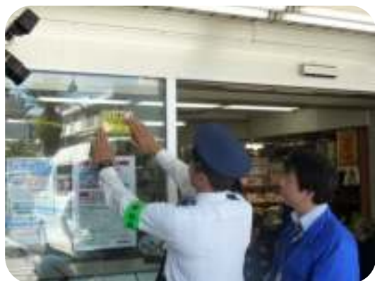
深夜スーパーにおける万引き被害防止キャンペーンの様相