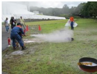
過去の訓練の様子