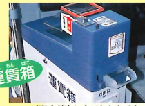
(料金箱ということもあるよ。)