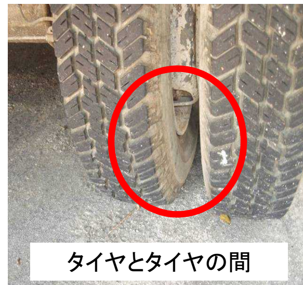
タイヤとタイヤの間