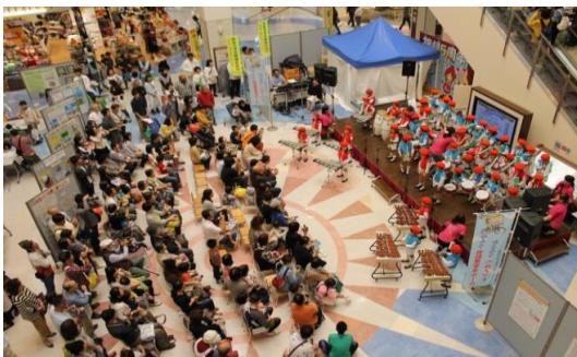
安全安心まちづくりひろばの様相