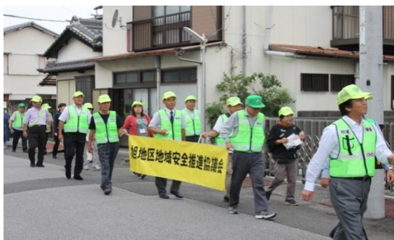
高知県安全安心まちづくり推進会議構成員による見守り活動