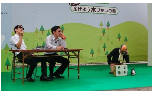
特殊詐欺被害防止の寸劇の様様