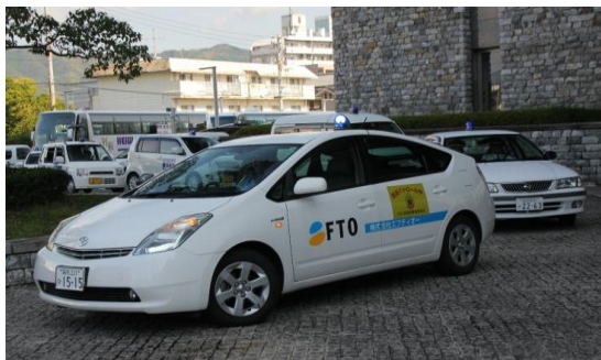
協定締結事業者による見守り活動