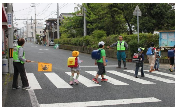
事業者による通学路の見守り活動