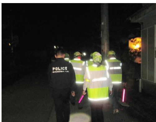
防犯活動団体によるパトロール