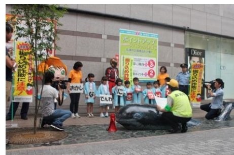
特殊詐欺被害防止のキャンペーンの様様