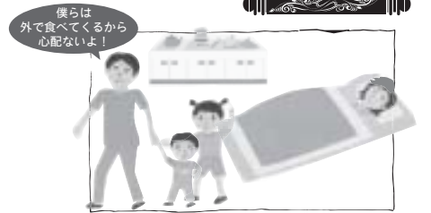
イラスト提供:こうち男女共同参画センター「ソーレ」