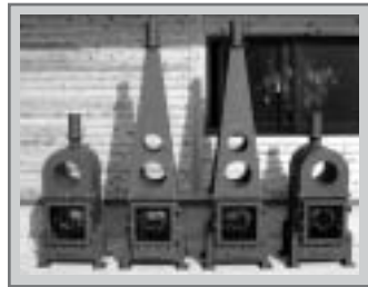
▲バイオマス・ストーブ