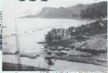
『ふるさとかんのうら』に見る昭和10年頃の白浜と小池川