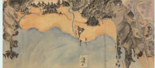
『浦々之図』の河内から生見