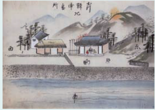
『中國四國名所旧跡』図、甲浦東股番所