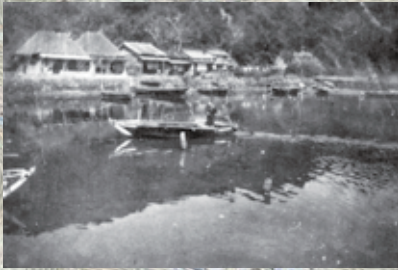
大正時代末の甲浦(『ふるさとかんのうら』)