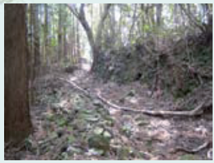
相間～野根、中の坂越