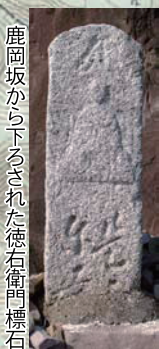
鹿岡坂から下るされた徳右衛門徳石