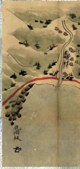
『郷浦圖』の尾崎、鹿岡坂