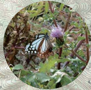
浜アザミとアサギマダラ