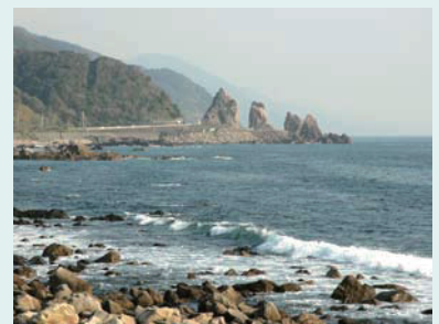
近代以降切り開かれた鹿岡