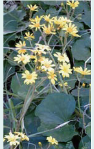
初冬に見られる ツワブキ