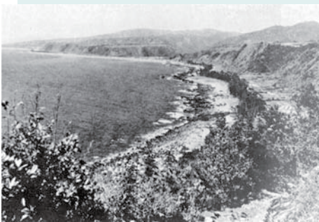
昭和10年頃の黒耳海岸