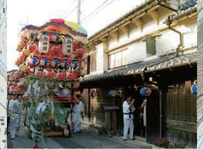
吉良川の町と秋祭り