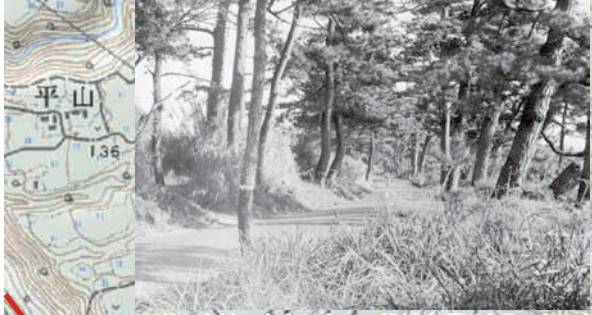
国道工事前の吉良川立石の松並木(『写真集・室戸』)