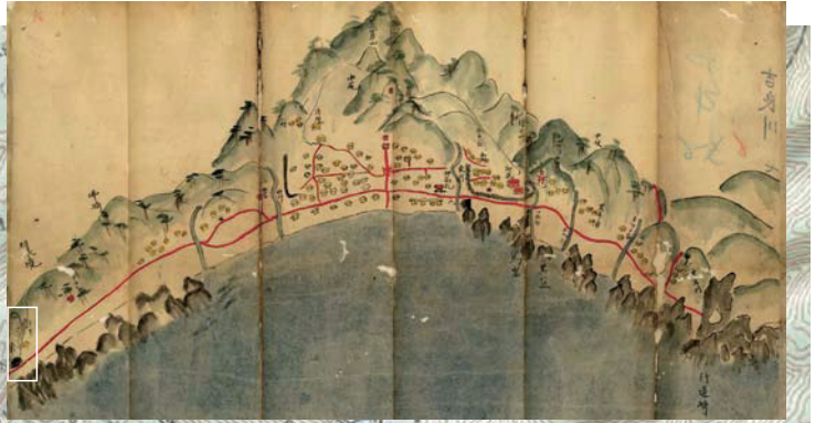
『郷浦圖』の行当から立石