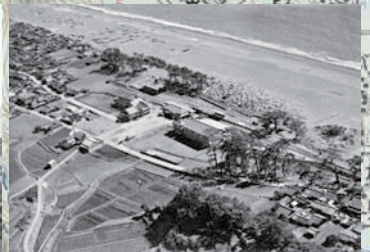
昭和初期旧安芸駅前空撮