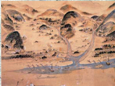
『安芸村屏風』右扇部分(個人蔵)