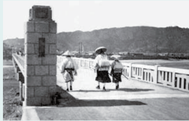
安芸橋を渡るヘンロ(個人蔵)