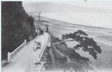
近代になって山肌を掘削した新城の道