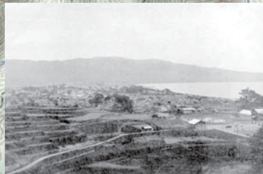
昭和初期の安芸