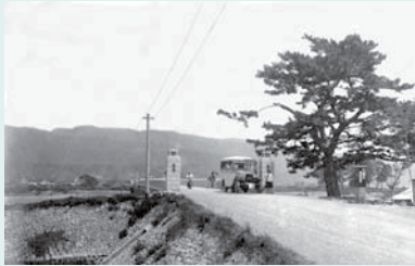
昭和初期の安芸橋の西