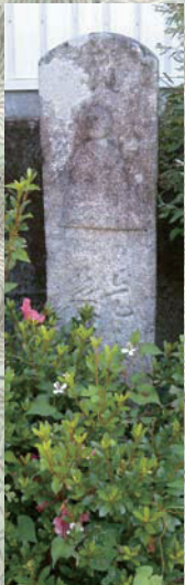
佐賀中角の徳右衛門標石