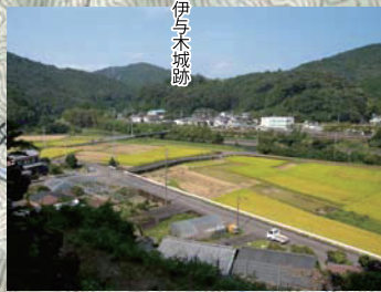
随正寺跡地からの伊与喜景観