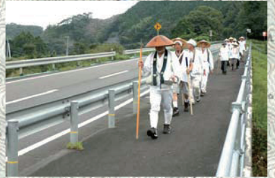
国道を歩く遍路の集団(不破原)