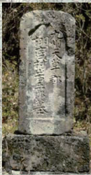
熊井坂のへん口臺