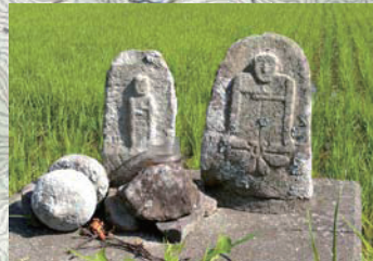
熊井坂登り口の中世石仏