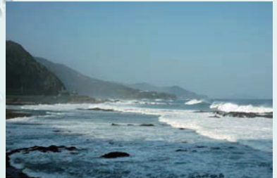
灘の海岸この辺りは波の高いときは通行ができなかったと思われる