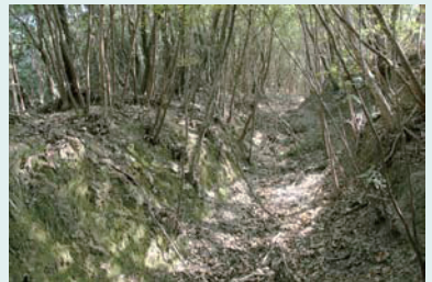
松山寺坂(ナダミネ坂)