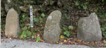
一ヶ所に集められる丁石