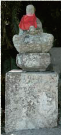
標石を兼ねる鯨供養地蔵石仏 (海蔵院)