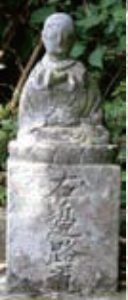
邊路道と刻す地蔵石仏