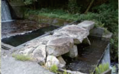
大戸への登り口、西川に架かる石橋