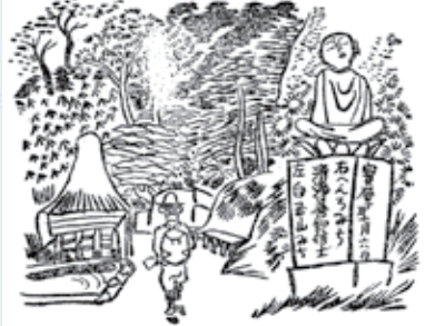
白皇山への分岐にある地藏標石 『文と画・四國遍路』