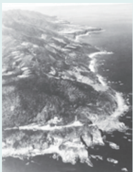
昭和40年の足摺岬