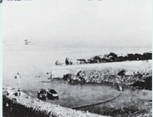
昭和二十五年の貝の川港