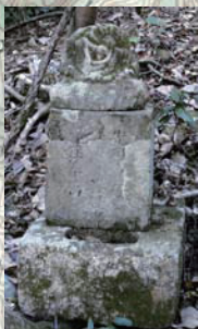
脇ノ川シバオレ地蔵