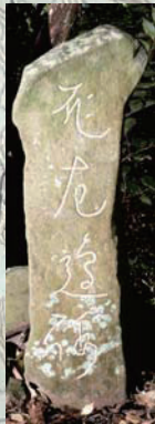
十文字にある近世標石(文字輪郭強調)