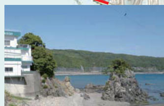
大浦へは岩の間を通過