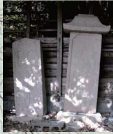
ドフゲンドウ坂峠墓塔