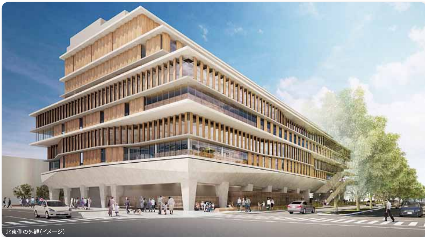
北東側の外観(イメージ)