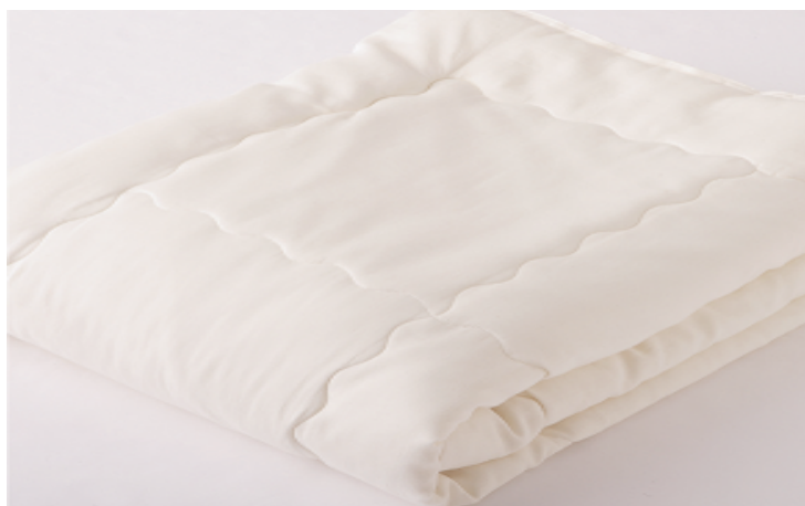
有機ソフトシルクふとん