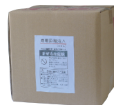
専用添加液 1Lボトル×4本入りまたは 10Lコンテナ