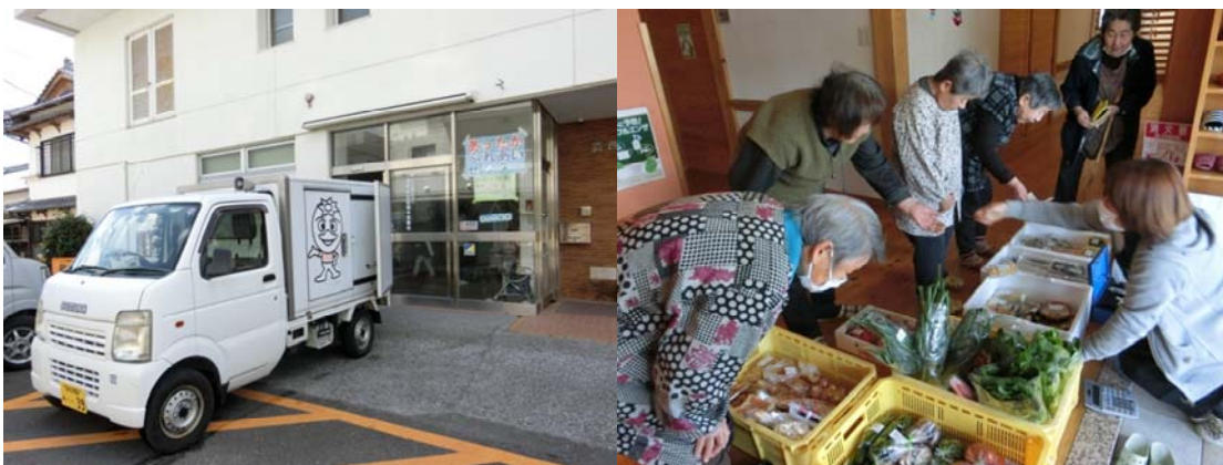
（芸西村での移動販売の様子）