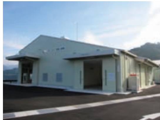
医療廃棄物処理施設「エコサイクルセンター」

※参考 平成24年度受入実績 5,605キロリットル 平成25年度受入実績 5,786キロリットル