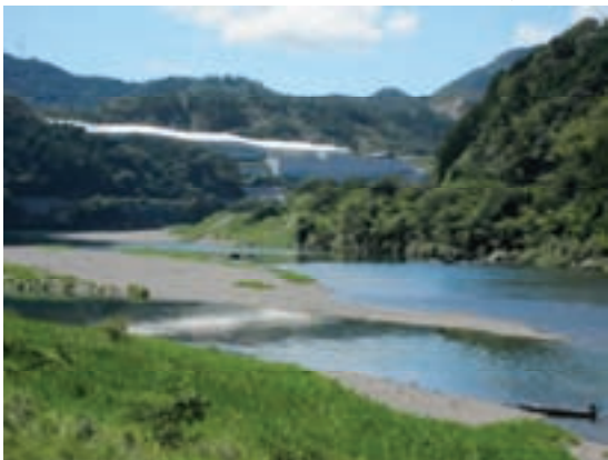
管理型最終処分場「エコサイクルセンター」

※参考 平成24年度受入実績 18,542トン 平成25年度受入実績 13,640トン