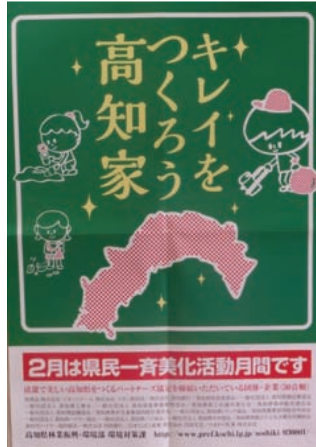
美化活動啓発ポスター (H26. 2)

一方では、不法投棄やごみのポイ捨てがなくならない状況もあり、県民総参加の取組みとしていくことが必要です。