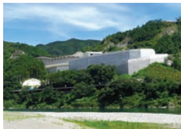
開業したエコサイクルセンター（日高村）

産業廃棄物の適正処理を図るため、平成 23 年 10 月に管理型産業廃棄物最終処分場を整備するとともに、産業廃棄物管理票（マニフェスト）や優良産業廃棄物処理業者認定制度の普及に取り組んでいます。