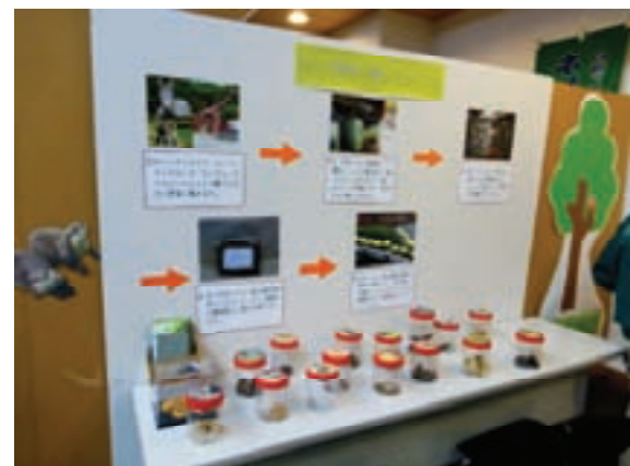
えこらぼの文化祭での展示