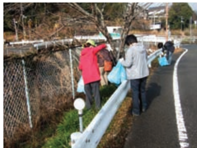
美化活動の様子(佐川町)