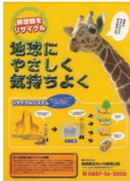
リサイクルポスター