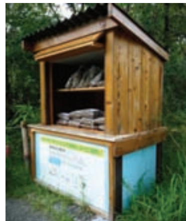
新しく設置した堆肥配布施設