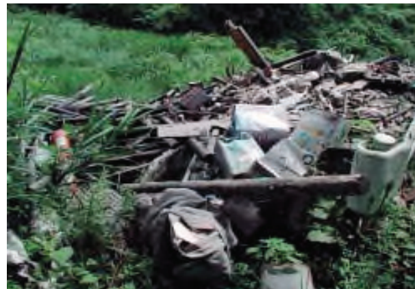
廃棄物の不法投棄現場の一例

そのため、安芸・中央東・中央西・須崎・幡多の各福祉保健所に警察OBを廃棄物監視員として配置し、日常的な監視・指導を行う一方、福祉保健所・土木事務所・市町村・警察署などで構成する「産業廃棄物等連絡協議会」を設置し、一致協力して不法投棄問題に当たっています。