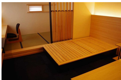
客室の様子 （※寝具等搬入前）