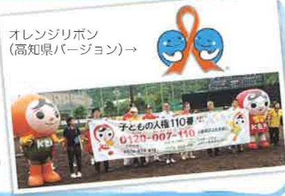
オレンジリボン (高知県バージョン)→

子ども一人ひとりが尊重され、人権が守られるなかで、安全安心に成長できる環境づくりをし、子ども同士も互いを尊重する社会を実現します。