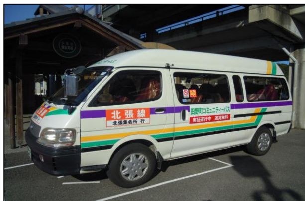
<田野町コミュニティバス：H29.1～実証運行を開始>