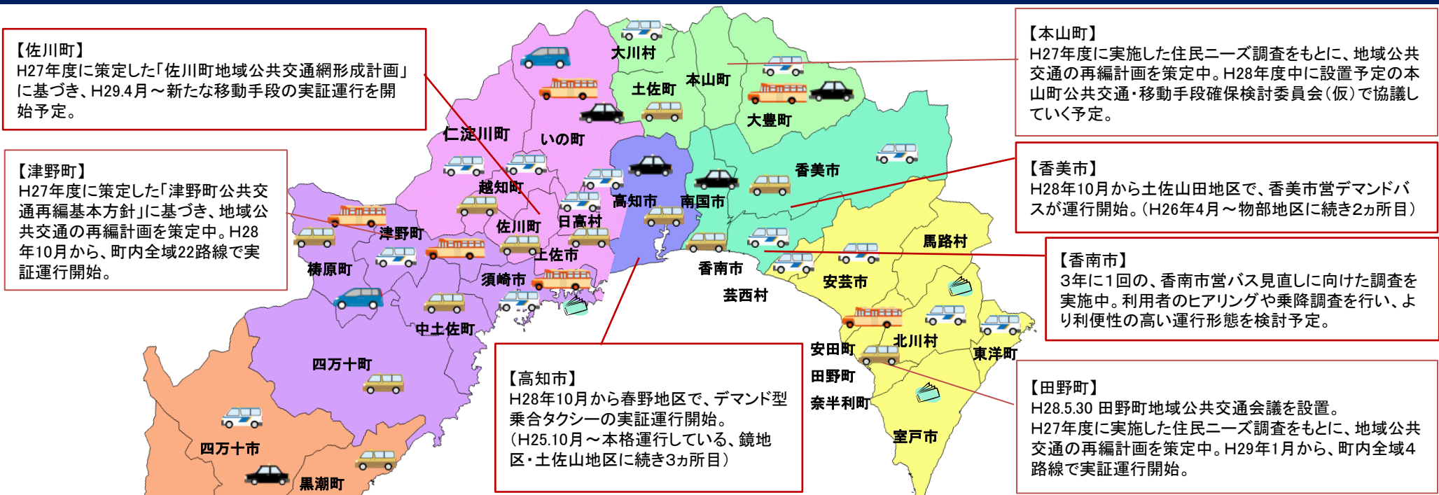
移動手段確保対策の取り組みを行っている市町村(H29.1.31時点)