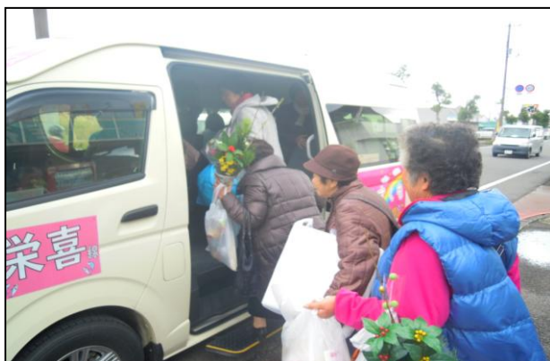
<宿毛市営バス：H28.10～実証運行中>