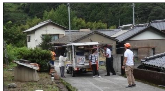
<移動販売状況：いの町吾北地区②>