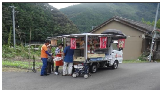
<移動販売状況：いの町吾北地区①>