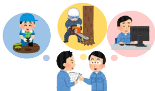
きめ細やかなフォローアップ