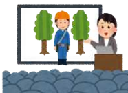
林業就業希望者への情報発信