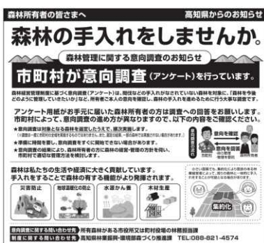
新聞広告の内容（高知新聞R5.12.21朝刊）