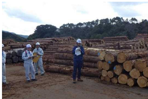
研修会開催の様子