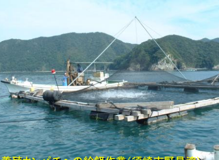
養殖カンパチへの給餌作業(須崎市野見湾)

人間は生物学的に単一種であり、ウシ、ブタ、ニワトリにしても「品種」は多数ありますが分類学上は単一種です。一方魚は3万種が存在するとも言われ、その生理、生態や病気についても多様で、家畜に比べて研究が進まない原因ともなっています。 ただし、産業的に見れば、有益な魚種は限定されており、特に