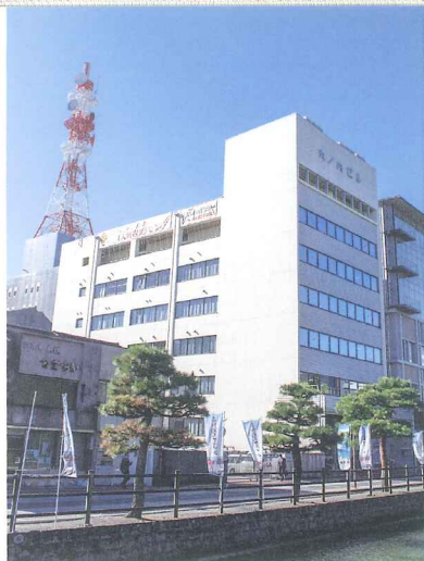
高知県立人権啓発センター (丸ノ内ビル4~6F)