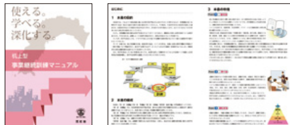
高知県「机上型事業継続訓練マニュアル」 http://www.pref.kochi.lg.jp/soshiki/010201/bckunrenmanual.html