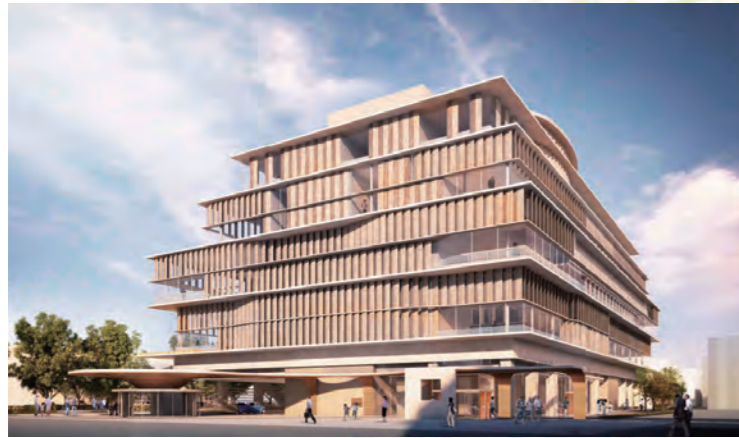
南西側の外観（イメージ）