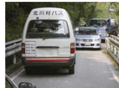
▲幅員が狭隘で通行が困難(国道493号:北川村)

注) 改良延長は、県道以上は車道幅員 5.5m 以上、市町村は 5.5m 未満を含む延長