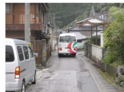
▲幅員が狭隘で通行が困難(県道中津公園線:仁淀川町)