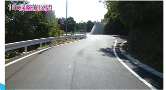
県道興津窪川線(四万十町興津坂)