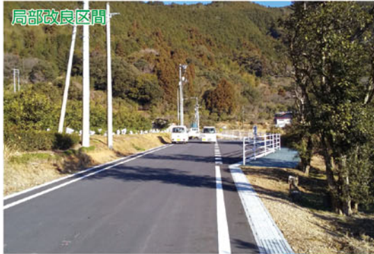
県道大久保伊尾木線(安芸市入河内)

比較的交通量の少ない地域において、2車線整備にこだわらず、地域の実情に合った道路の整備を地域住民の理解を得て進めるもので、2車線改良、1車線改良、突角・線形の是正及び待避所の設置などを効果的に組み合わせて実施しています。これにより、大幅なコスト縮減と整備効果の早期発現に繋がります。