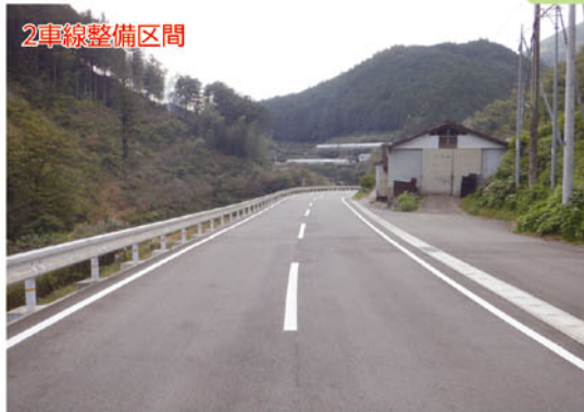
県道南国伊野線(高知市土佐山菖蒲)