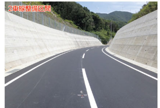
県道安満地福良線(大月町泊浦)