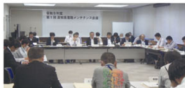
高知県道路メンテナンス会議

道路施設の修繕や更新を確実に実施していくために、県内の全ての道路管理者が一堂に会する「高知県道路メンテナンス会議」や県主催の講習会を通じて、関係機関との情報共有や技術の習得・継承を行っています。