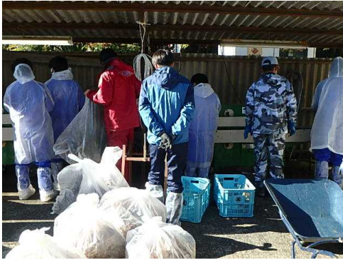
袋に詰まっているのが、収穫したミシマサイコです。

収穫したミシマサイコを出荷するために、まずは洗浄機で洗います。今度の作業は、カップ着用です。