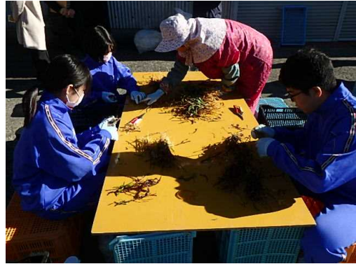
熱心な質問に、ヒューマンライフ土佐の方々も熱心に答えておられました。