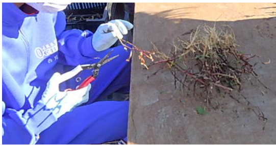
みなさん、丁寧に作業を進めていました。