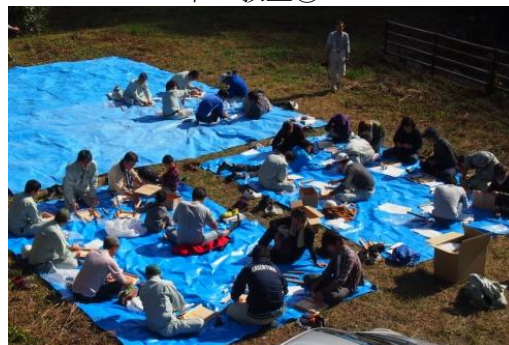
ぽかぽか陽気の中、気持ちよく作業ができました。