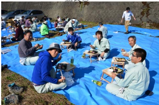
出来たばかりのテーブルで昼食タイム。