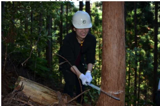
意外に女性の方がのこぎりの使い方が上手い場合も。