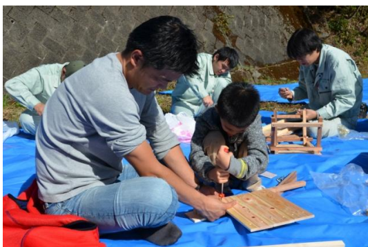
お父さんと一緒に …真剣です。