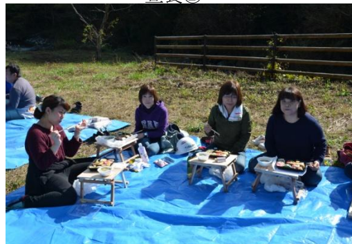
外で食べるお昼は美味しいね♪