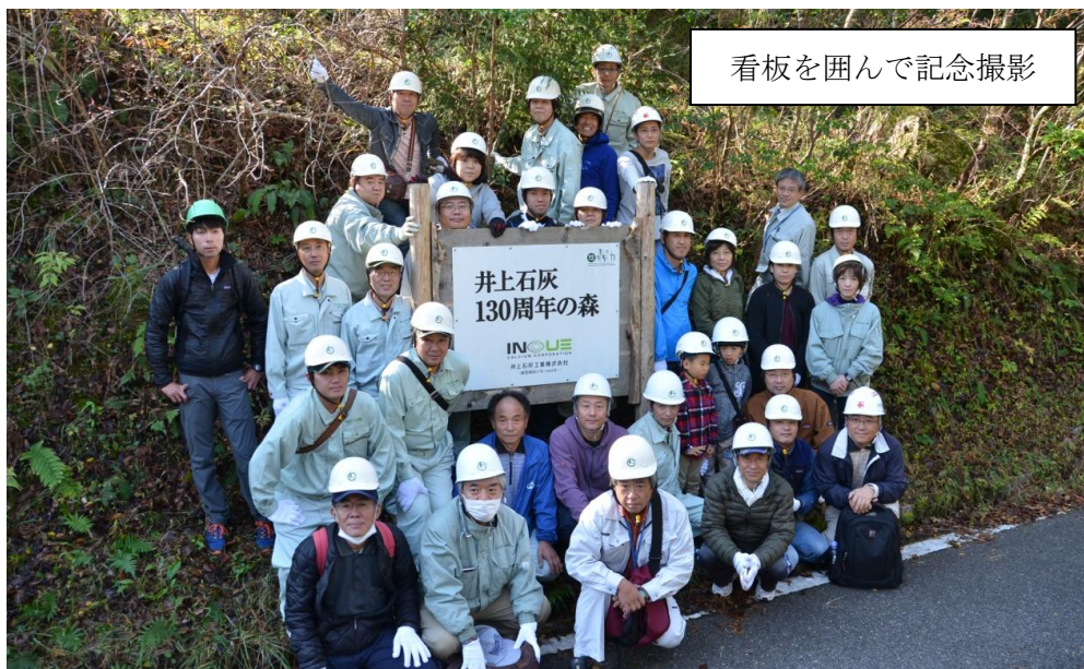
看板を囲んで記念撮影