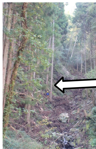
矢印の先にいるのが森林組合職員さんです。こんなに高い木を...

開会式の後、梶原町森林組合職員によるチェーンソーでの木材伐採のデモンストレーションが行われました。