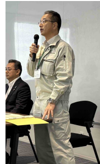
高知県林業振興・環境部 竹崎副部長