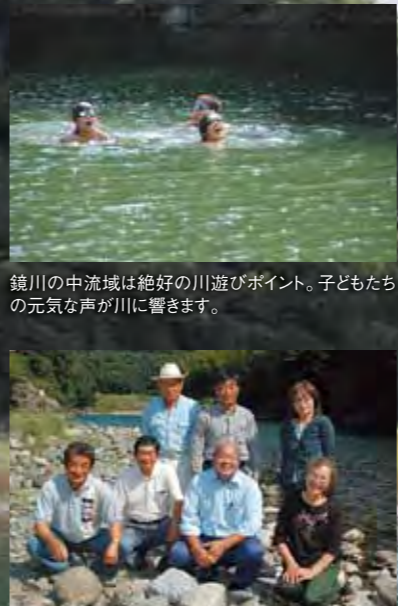
鏡川の中流域は絶好の川遊びポイント。子どもたち の元気な声が川に響きます。