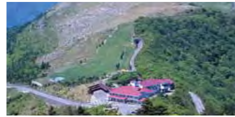
森林インストラクターと行く、森林セラピー体験。