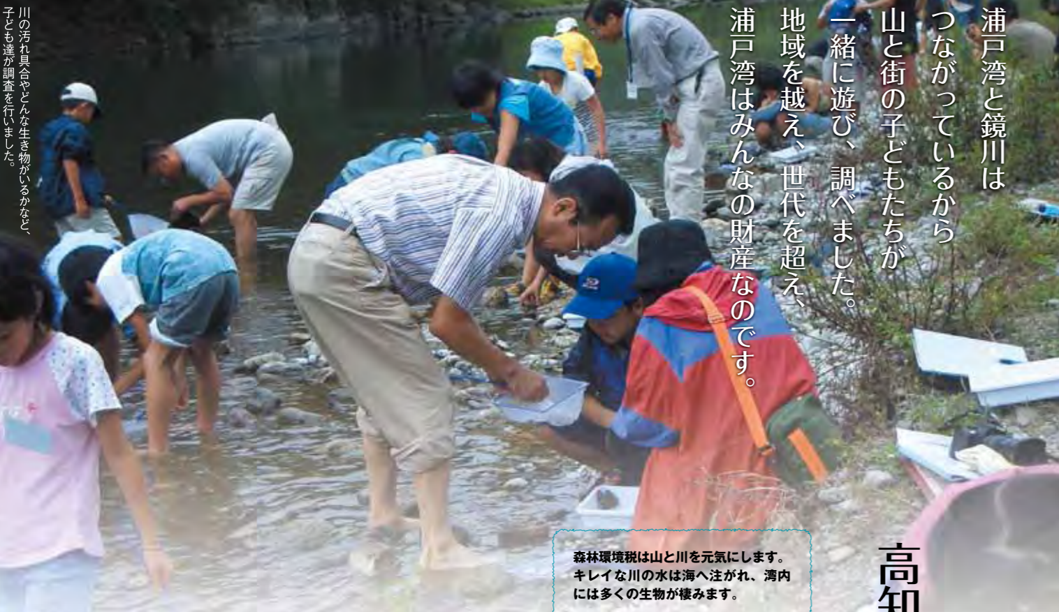
川の汚れ具合やどんな生き物がいるかなど、子ども達が調査を行いました。