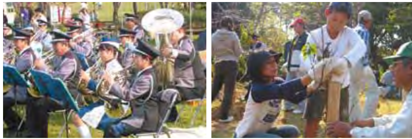
森林に親しみ、理解を深める2日間、3会場のイベント。