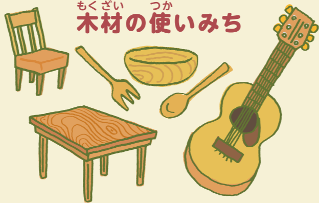
かく しょうじ がつき 家具、フローリング、食器、楽器など