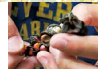
赤い実を取り出そうとすると、白い糸がすっと伸びてぶら下がるコブシの実。秋に楽しめる山遊びのひとつです。