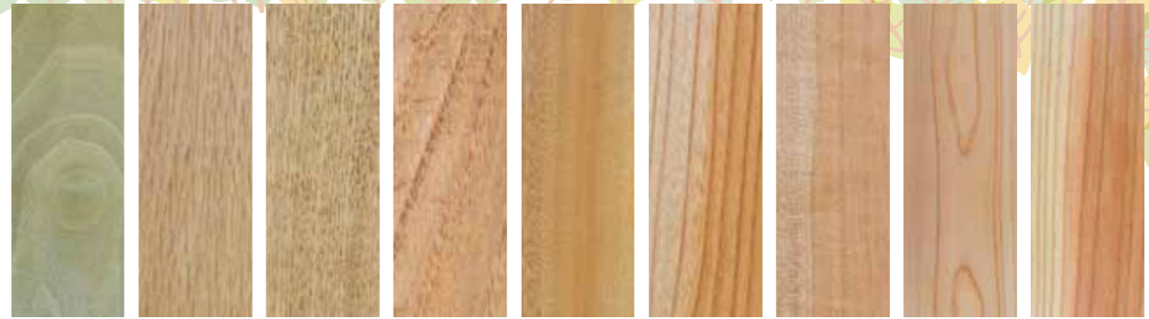
ホウノキ タモ ナラ クリ クスノキ ケヤキ サクラ ヒノキ スギ

いろんな種類の木を使った手作り積み木。木目や手ざわり、色、香りなど木がそれぞれ持つ個性を楽しめます。