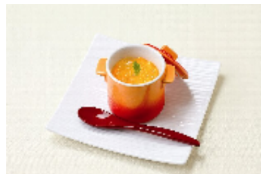
パンナコッタ~ジンジャージュレ~ 日本一の生産量を誇るショウガを使ったスイーツです。