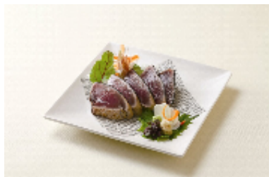
かつおの塩たたき