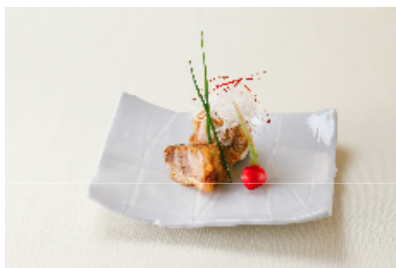
窪川米豚ロースカツ