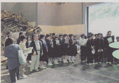
見学後のお礼のお手紙(見学に来た子供たちから)