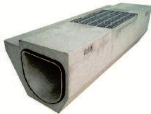
DOB-AD(基礎付きタイプ) 排水性舗装対応型