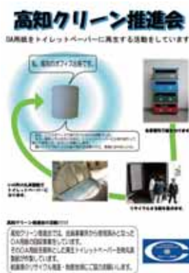
高知クリーン推進会 広報用チラシ

高知県の事業所から出た使用済みOA用紙を100%原料として、製品化したものであり、つまり、高知のオフィス出身のトイレトペーパーです。