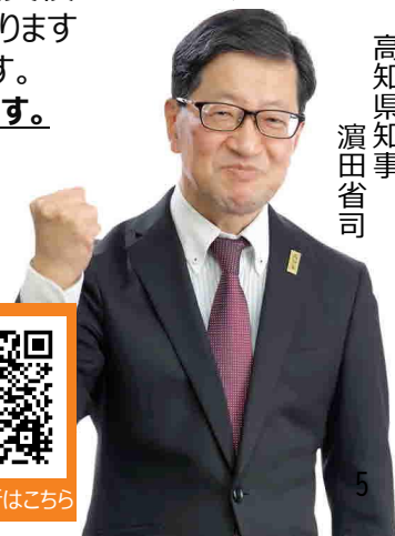
高知県知事 濱田省司