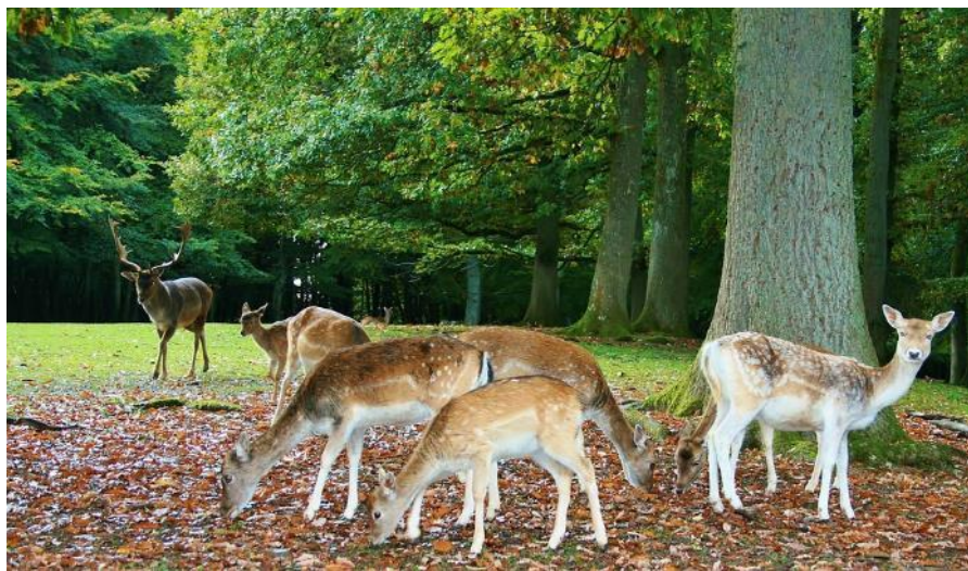
(1) 被害の現状 (平成27年度)